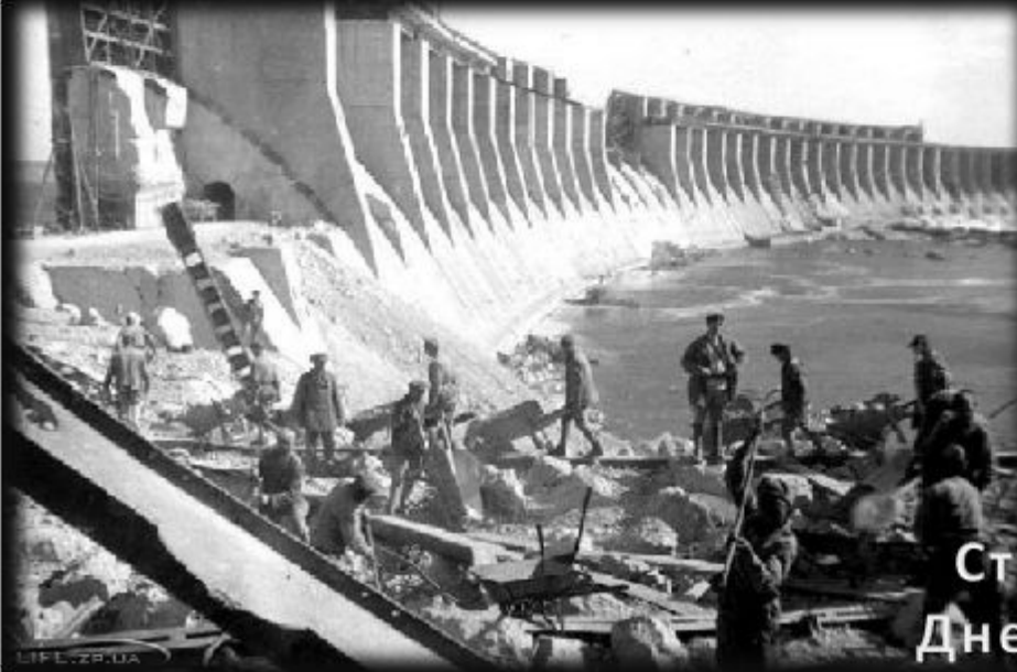
Строительство Днепровской ГЭС