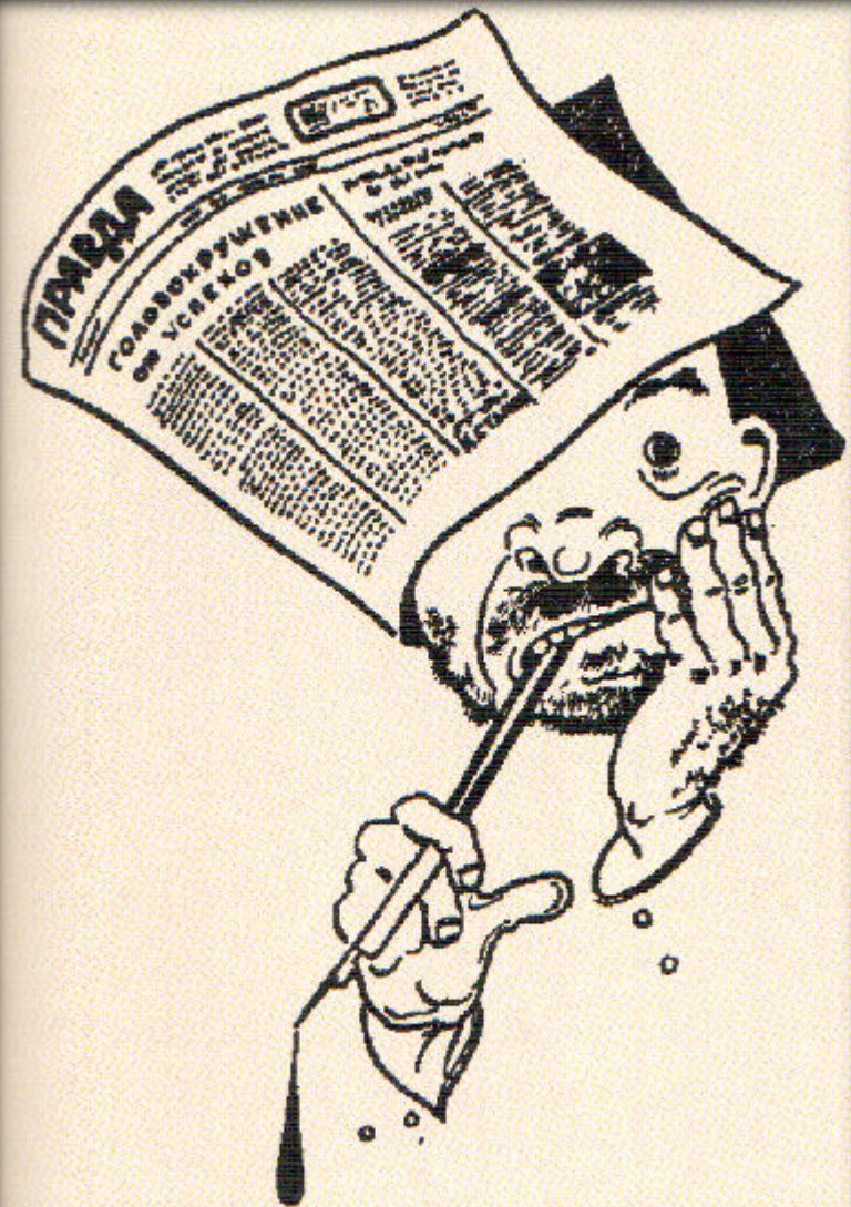
М. Х. «Средство от головокружения. Освежающий компресс на горячую голову» («Крокодил», 1930 г.).